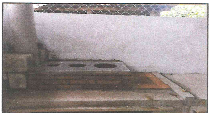
Foto 4: Colocación de chimenea, ladrillos de losa y tayuyos en la sustitución de polletón tradicional por polletón de plancha.