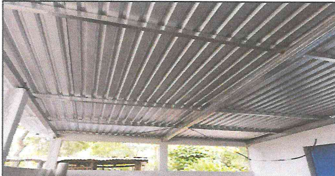
Foto 1: Surtitución completa de lámina por lámina troquelada de alucín y estructura de madera por metal, así tambien, restauración de sistema eléctrico.