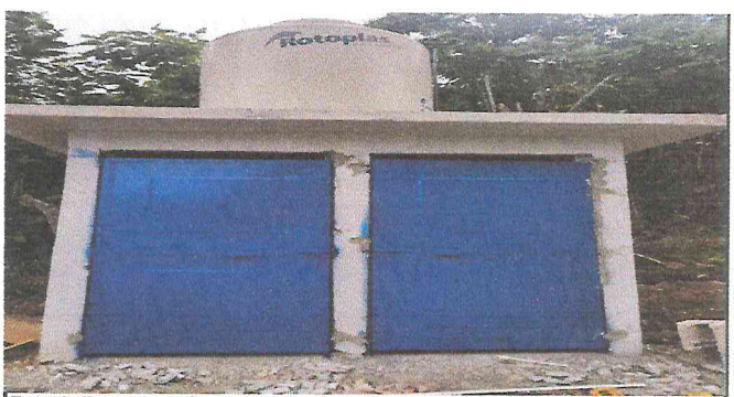
Foto 6: Restauración de paredes, columnas y fundición de terraza, sustitución de puertas, repello e instalación de tinaco para servicio de sanitarios y cocina.

Observación: Si es necesario se pueden agregar hojas adicionales y actualizar el número de hojas.