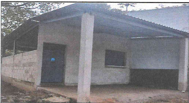
Foto 3: Restauración completa de cocina, puertas, repello enfrente y por dentro.