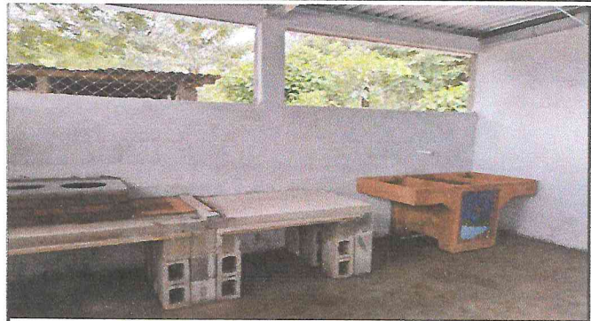
Foto 2: Sustitución de polletones por plancha de metal y chimenea, sustitución de pila y piso de concreto.